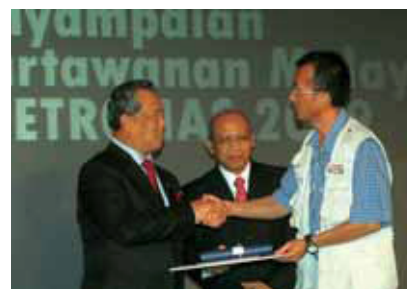
▼ 南洋報業集團得獎單位於2008年度拿督黃紀達新聞獎頒獎禮合照。