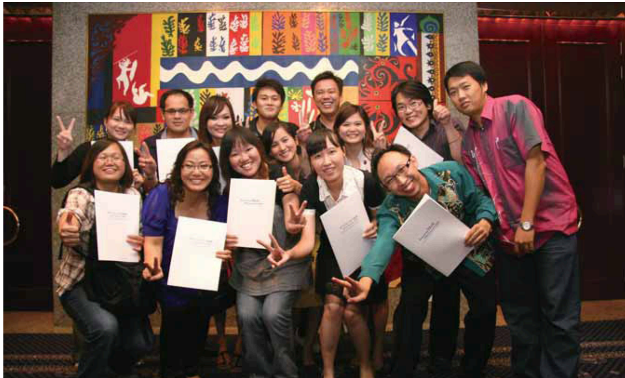
▼ 星洲媒體集團得獎單位於2009年度肯雅蘭蜆殼新聞獎頒獎禮合照。